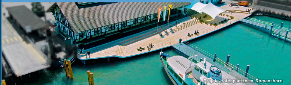
Projekt Hafenplattform, Romanshorn

Kompetent und leidenschaftlich. Seit 1911.